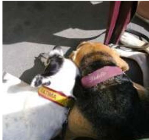
... mein geliebter Fidelio

Mit der Zeit habe ich dann auch mein Herrchen überzeugt und es kam, wie es kommen musste, ich durfte für immer bleiben! Inzwischen ist ja auch der Rotzlöffel Ninio bei uns eingezogen und damit ist nun die Familie komplett. Wir lecken uns die Ohren aus, wir rangeln auf der Wiese miteinander und halten unsere Menschen immer schön in Bewegung. Wir alle, immerhin drei Griechen aus Aegina und natürlich die „mürrische“ Maja aus Korfu, sind ein tolles Team mit unseren Menschen. Denken auch Sie immer daran, der Trend zum Dritthund ist echt IN und